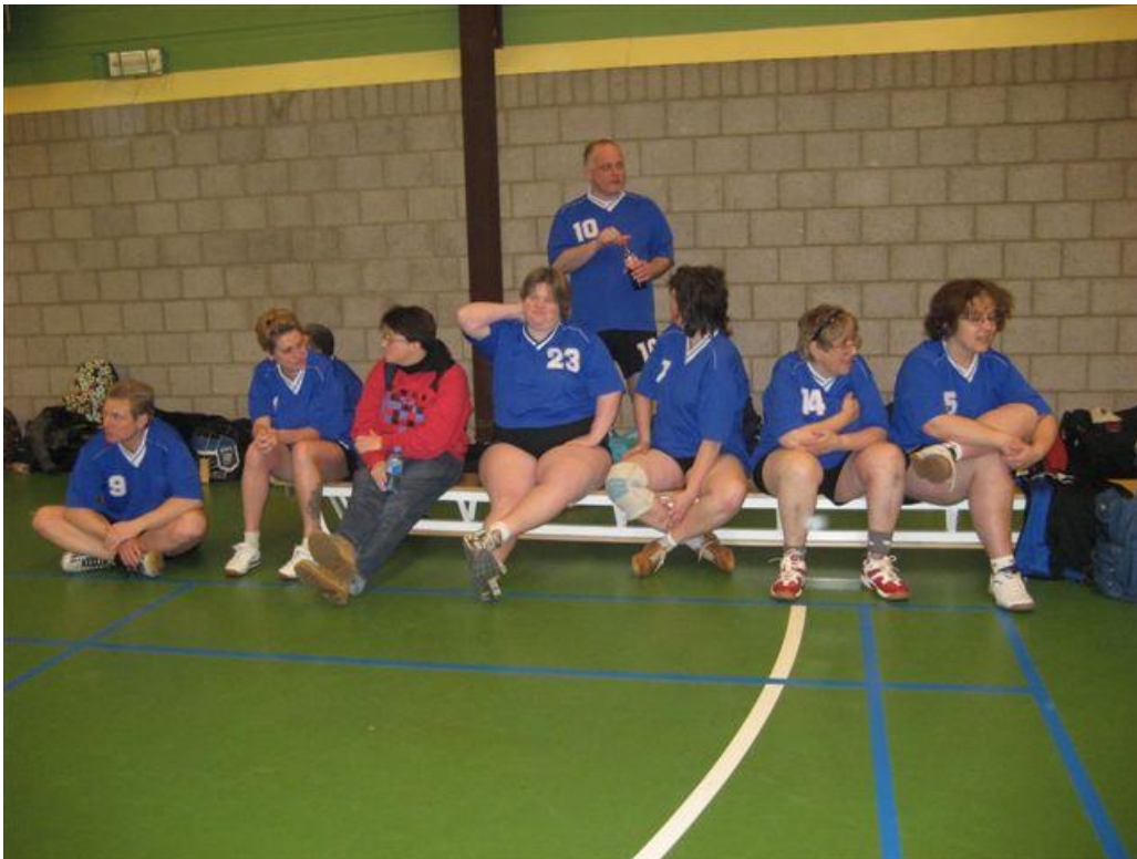
21 februari, toernooi bij KSV Heerhugowaard.

Ps:Als iemand een verslag(je) wilt schrijven, mag hoor! Lever het gewoon bij ons in !