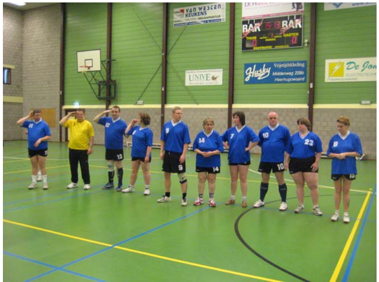
Géééééf .....8 !!!!!