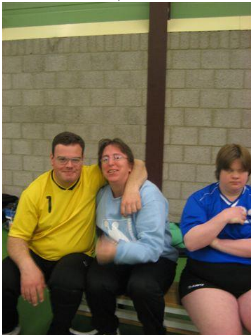
Van der Sar met z`n coachs (Quint & Anita)